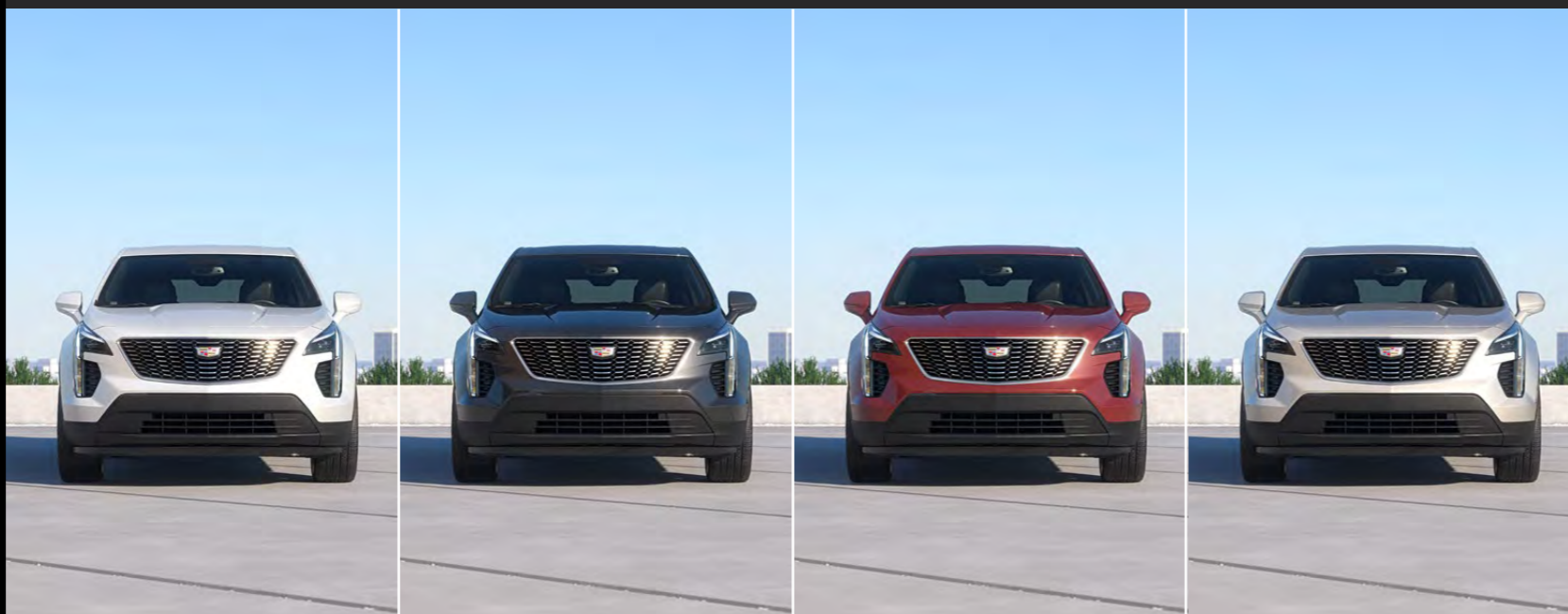
ABALONE WHITE TRICOAT