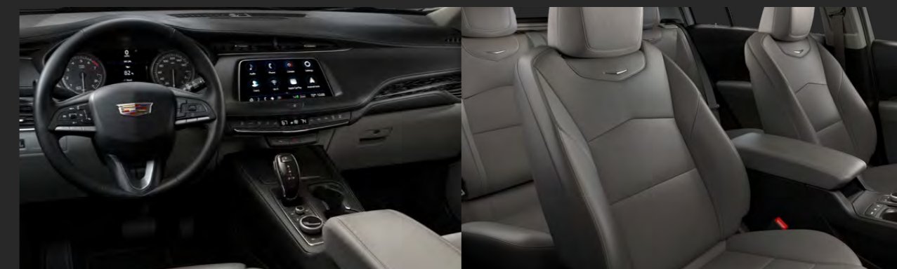
JET BLACK / LIGHT PLATINUM DISPONIBLE EN VERSIÓN PREMIUM LUXURY