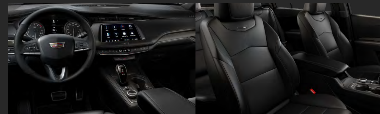
JET BLACK / CINNAMON STITCH DISPONIBLE EN VERSIÓN SPORT