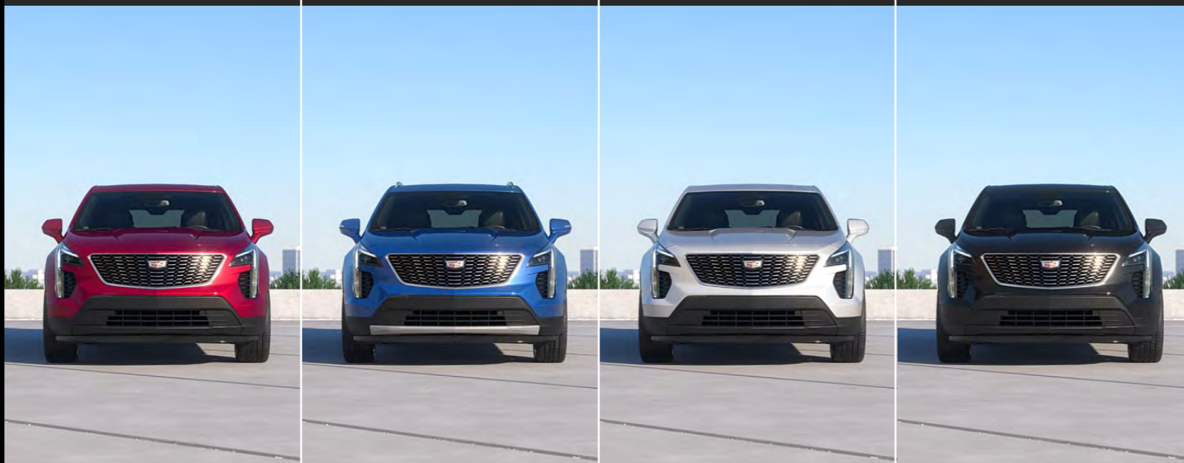
RADIANT RED METALLIC