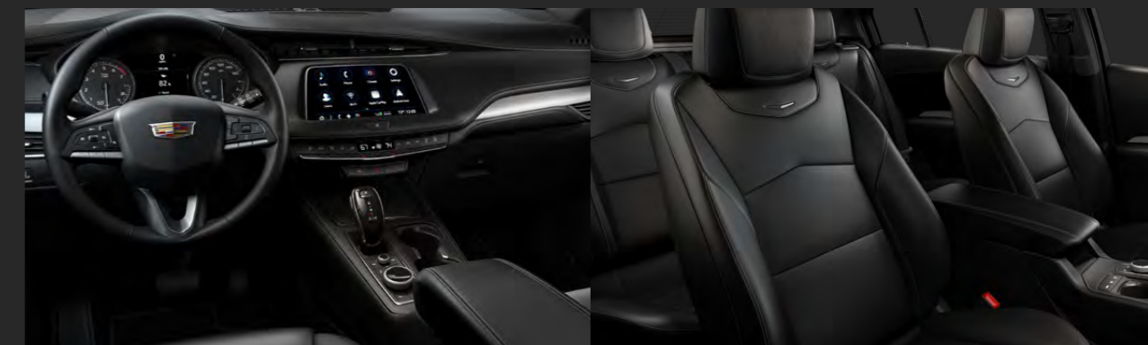
JET BLACK DISPONIBLE EN VERSIÓN PREMIUM LUXURY